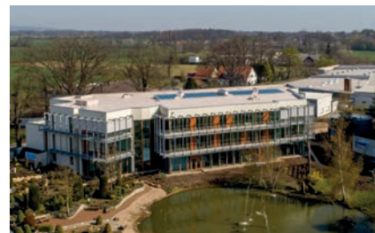
Neues Verwaltungsgebäude von Rila.

Gemeinsam blicken Rila und TEAM auf eine erfolgreiche und langjährige Zusammenarbeit zurück. Schon 2002 entschied sich Rila im Rahmen des Neubaus eines hochautomatisierten