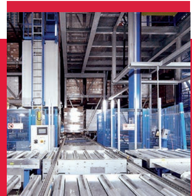
Die Integration von automatischen Systemen erhöht die Produktivität der Anwendung.

Flexibilität, Modularität und Skalierbarkeit