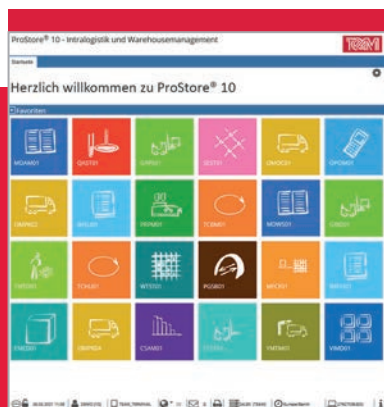
Die Oberfläche von ProStore® präsentiert sich übersichtlich und aufgeräumt.

Diese und alle weiteren Module von ProStore® sind auf Logistik 4.0 ausgerichtet und unterstützen sämtliche Komponenten der Digitalisierung im Lager.