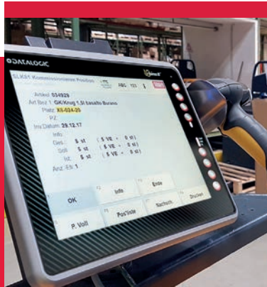
Das integrierte Staplerleitsystem mit modernen Funkterminals verkürzt Wege und optimiert Abläufe.