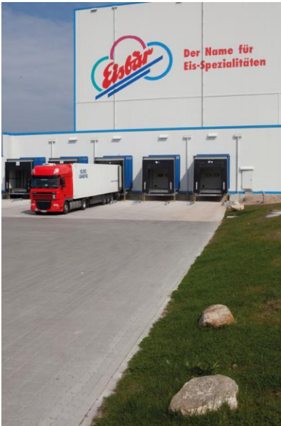
EisberEis_Verladung-300dpi-CMYK.jpg: Tourenreine Versandabwicklung an fünf Stellplätzen