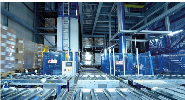
4-Eisbär-Eis_6186358- 300dpi-CMYK.jpg.jpg: Bis zu 100 Millionen Portionen Eis lassen sich im erweiterten Hochregallager vorhalten