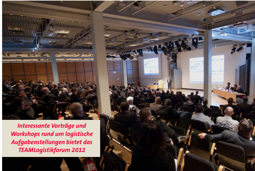
Interessante Vorträge und Workshops rund um logistische Aufgabenstellungen bietet das TEAMLogistikforum 2012