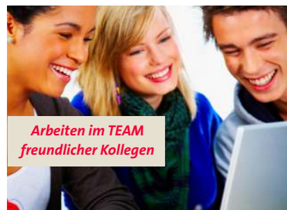
Arbeiten im TEAM freundlicher Kollegen

Weitere Informationen finden Sie unter www.team-pb.de/karriere . Wir freuen uns auf Ihre Bewerbung!