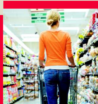
Durch die transparente Gestaltung der Prozesskette stärken die Unternehmen das Verbrauchervertrauen.