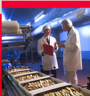
Eine chargengenaue Rückverfolgbarkeit ist vielfach eine Grundvoraussetzung bei der Lieferantwahl.