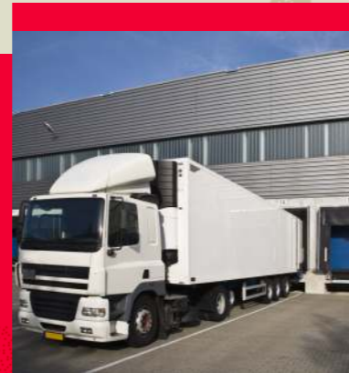
Vom Lieferanten bis zum Kunden - ProTrace bietet eine durchgängige Rückverfolgung.