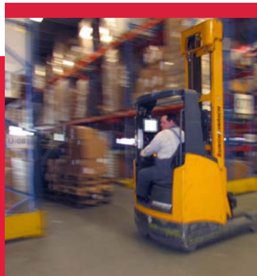
Das integrierte Staplerleitsystem mit modernen Funkterminals verkürzt Wege und optimiert Abläufe.