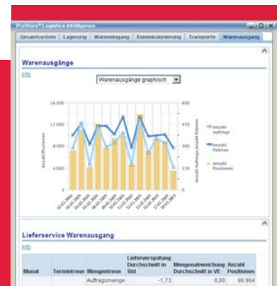
Kennzahlen schaffen Transparenz. Auf Knopfdruck wird die Effizienz des Logistiksystems sichtbar.