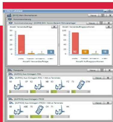
Zeitgenau wird die Auslastung des Logistiksystems visualisiert. Planabweichungen werden sofort sichtbar und können korrigiert werden.