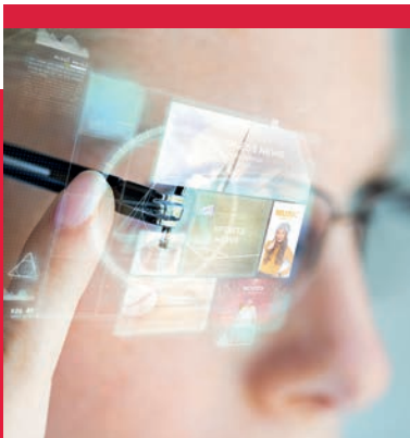
Pick-by-Vision-Lösungen erleichtern Kommissionier-Tätigkeiten und sorgen für effizienteres Arbeiten.

Bei Bedarf kann eine Hochverfügbarkeit an 365 Tagen im Jahr sichergestellt werden.